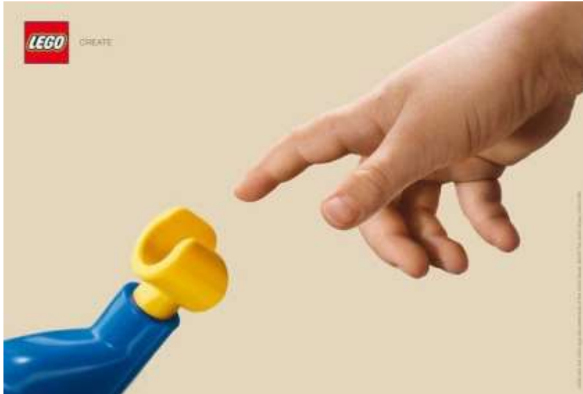
Imagen 1 Empresa de Juguetería