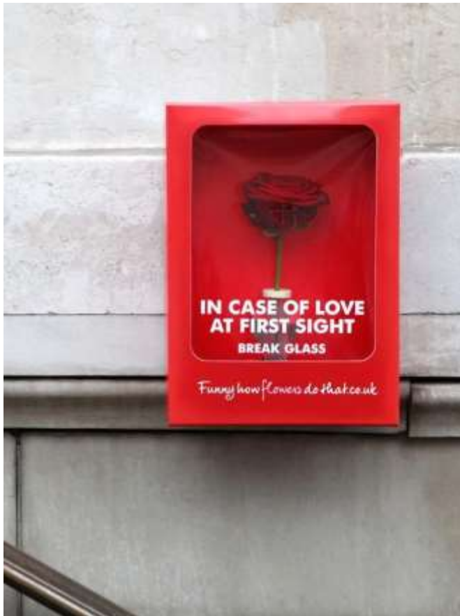
Imagen 3 Campaña de Floristería